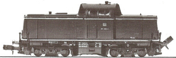
BR 211 Simplex